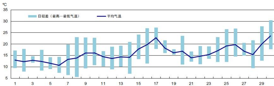
2020 年 4 月鄞州国家基本气象站日平均气温和气温日较差变化图

全市月平均气温 15.5℃，较常年偏高 0.1℃；上旬 12.9℃，偏低 0.6℃；中旬 16.5℃，偏高 1.3℃；下旬 17.2℃，偏低 0.2℃。